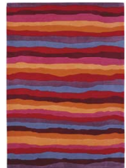
Colección Colourful Summer