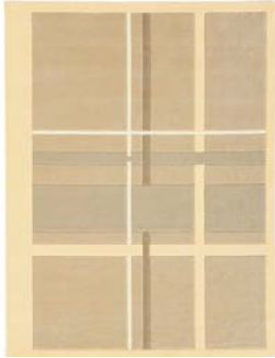
Colección Gentle Lines

Diseños depurados, colores crema y chocolate... Estas alfombras armonizan suavemente su salón con el otoño.