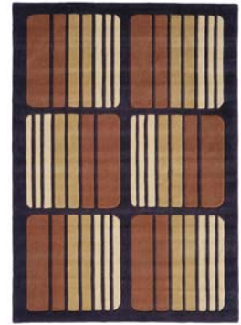
Colección Chocolate Eclair