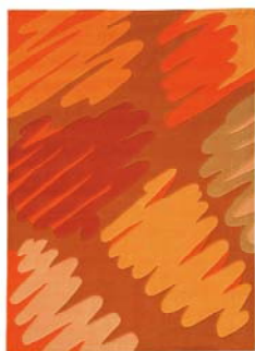
Collection Action Painting

Ces tapis vous rappelleront les touches colorées de l'été et les vagues de la grande bleue .