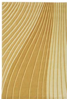
Collection Deco Art

Des lignes scintillantes qui s'étendent à perte de vue ou des velours de différentes hauteurs... Tels sont les secrets des élégantes collections Deco Art et Chic Attention.