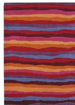
Collection Colourfull Summer

Prix public conseillé : à partir de 52,8 €