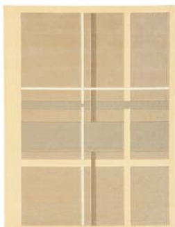
Collection Gentle Lines

Des graphismes épurés, des couleurs crèmes et chocolatées... Ces tapis harmonisent tout en douceur votre salon à la saison d'automne.