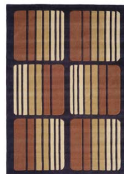
Collection Chocolate Eclair

Prix public conseillé : à partir de 351,54 €