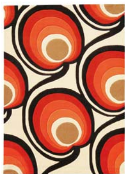
Collection Retro Touch

Les tapis de la collection The Popular vont réchauffer l'atmosphère de votre demeure grâce à leurs couleurs détonantes et leurs graphismes inspirés des seventies.